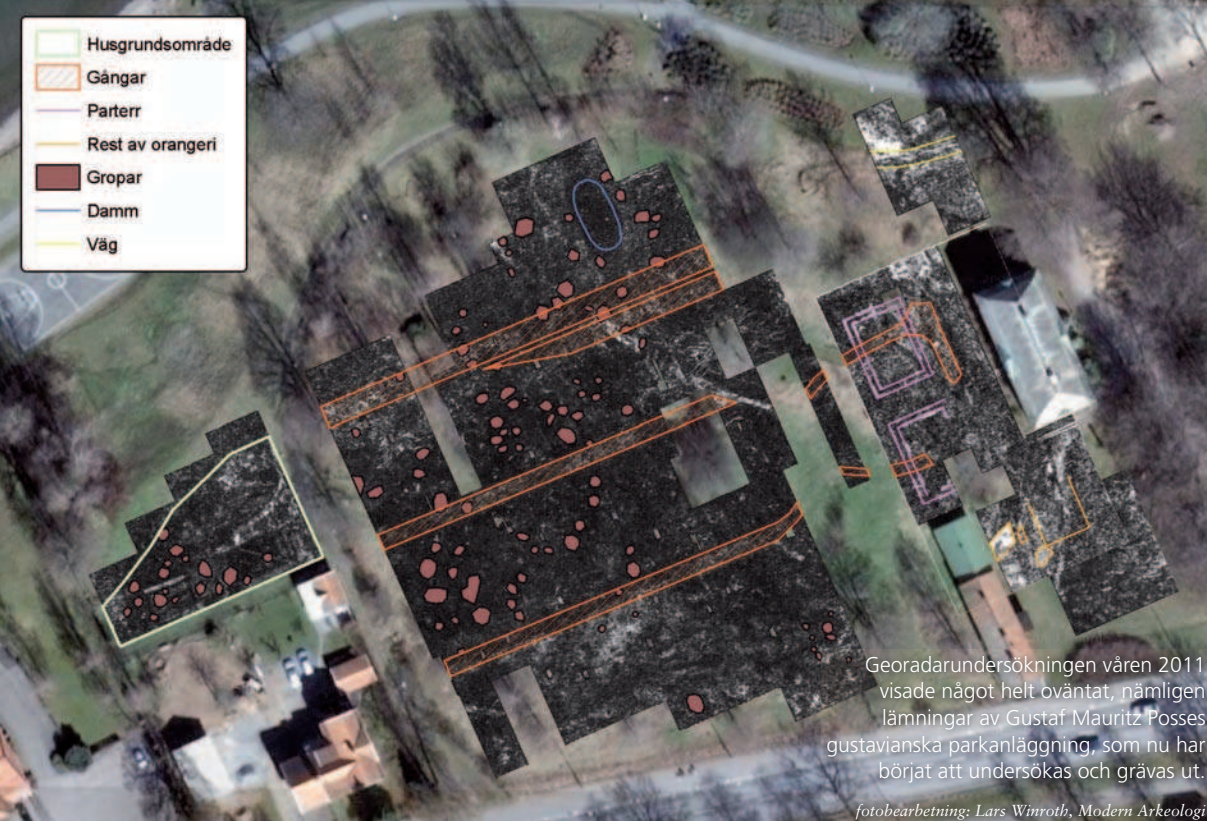
Georadarundersökningen våren 2011 visade något helt oväntat, nämligen lämningar av Gustaf Mauritz Posses gustavianska parkanläggning, som nu har börjat att undersökas och grävas ut.