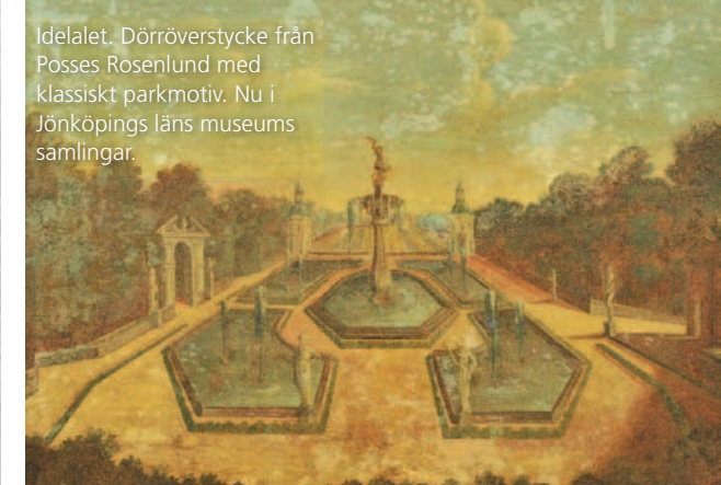
Idelalet. Dörröverstycke från Posses Rosenlund med klassiskt parkmotiv. Nu i Jönköpings läns museums samlingar.