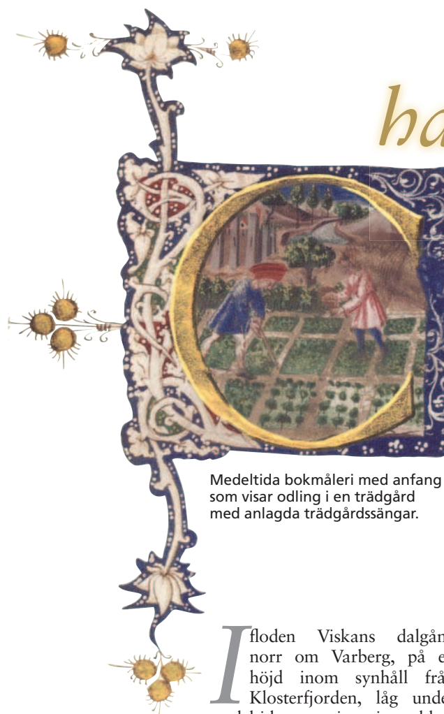
Medeltida bokmålari med anfang som visar odling i en trädgård med anlagda trädgårdssångar.