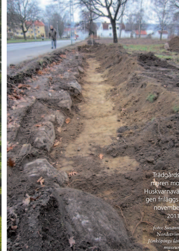
Trädgårdsmuren mot Huskvarnavägen friläggs i november 2011.