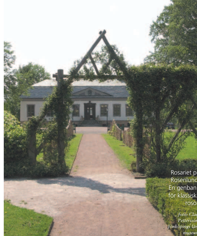
Rosariet på Rosenlund. En genbank för klassiska rosor.