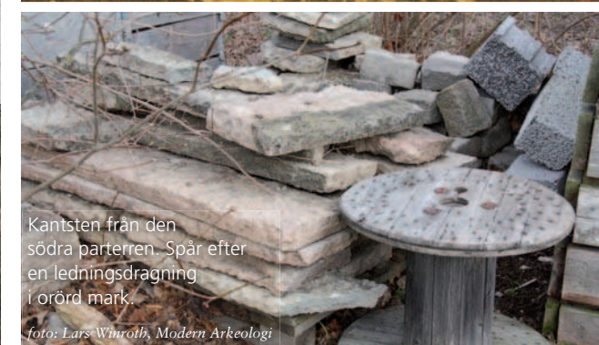
Kantsten från den södra parterren. Spår efter en ledningsdragnings i orörd mark.